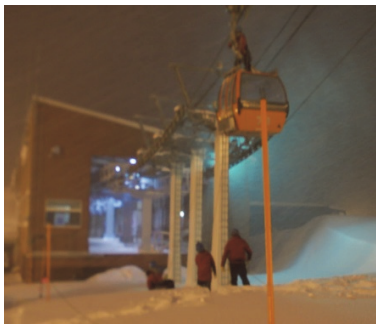
① エコークワッドリフト救助訓練の様子